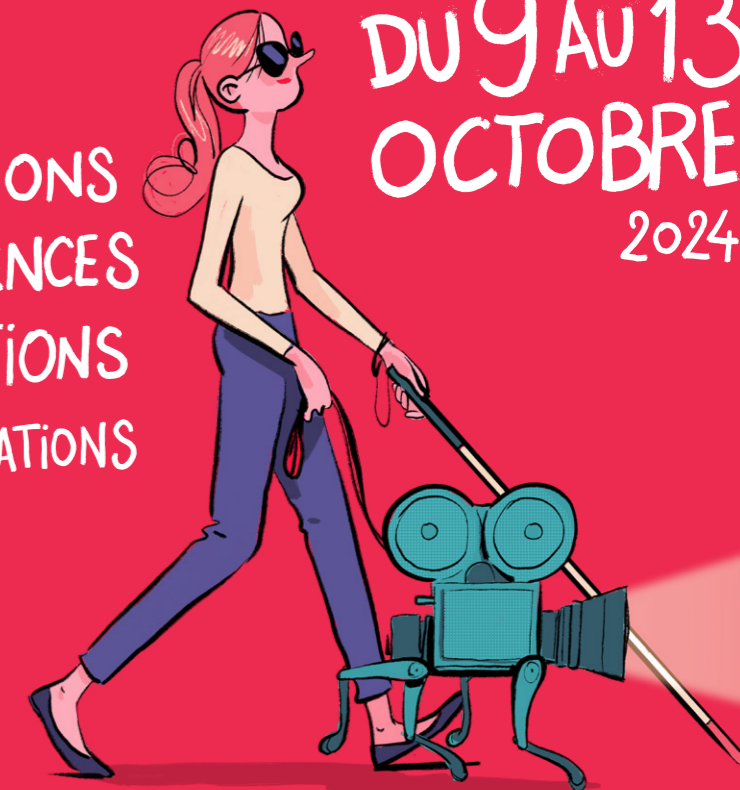
Illustration et graphisme : Julien Collignon - www.co2i.fr

ANIMATIONS CONFÉRENCES PROJECTIONS SENSIBILISATIONS